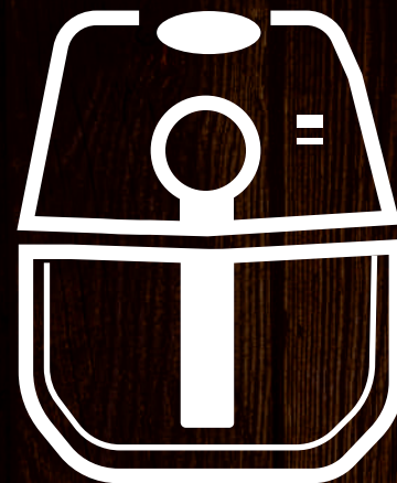
FRITADEIRA ELÉTRICA "AIRFRYER"