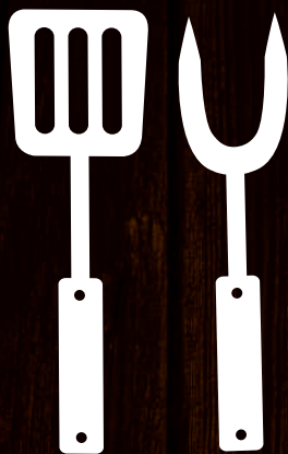
GRELHA - CHURRASCO